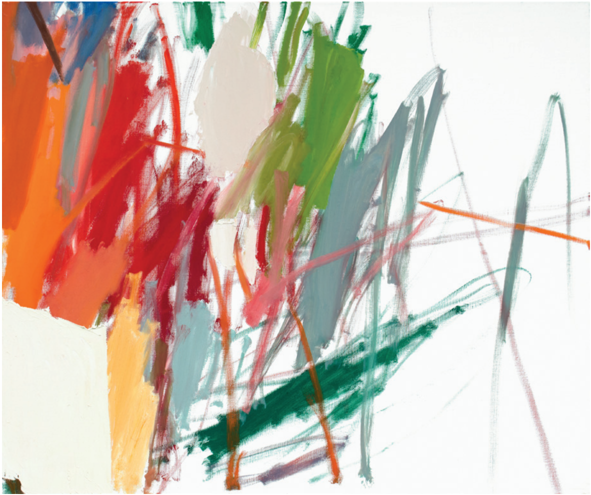
Karin Mairitsch «o.T.»